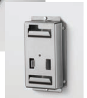
Quick disconnect wall mount bracket