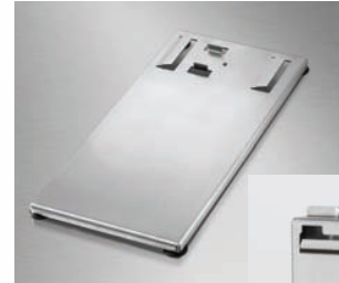
Suction Cup Table Base